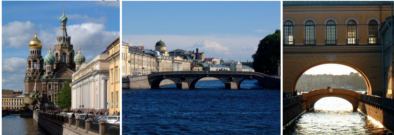
Visst förstår man att St Petersburg kallas Rysslands Venedig.