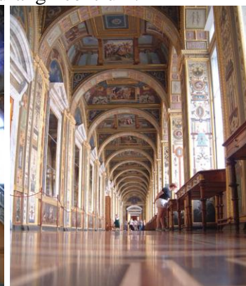
Vinterpalatset med Eremitaget är imponerande!

Under eftermiddagen besöker vi en annan stor begivenhet - nämligen Katarinapalatset i Pusjkin , staden som fått sitt namn efter nationalskalden Alexander Pusjkin. Det vackra rokokopalatset var ett av tsarfamiljens sommarresidens och är fyllt med dyrbara utsmyckningar, konst och möbler. En av palatsets största sevärdheter är Bärnstensrummet , där väggarna från golv till tak, är klädda med bärnsten. Något liknande finns förmodligen inte någon annanstans i hela världen!