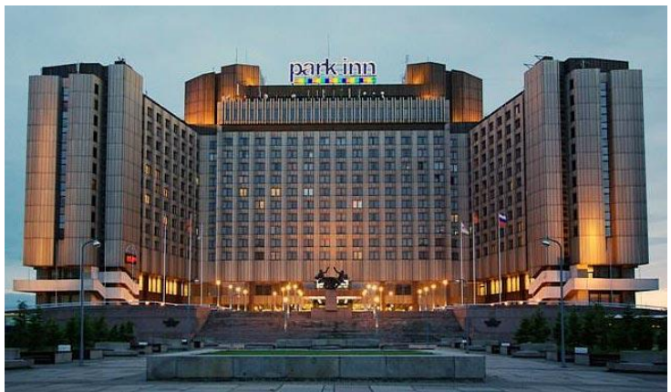
Park Inn by Radisson Hotel Pribaltiyskaya