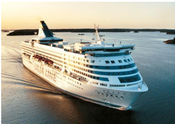
TallinkSiljas förstklassiga Helsingforsfartyg